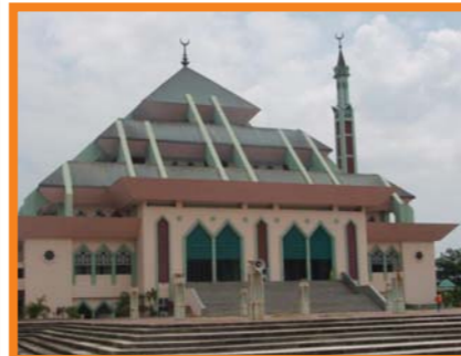
Gambar Masjid Raya Batam