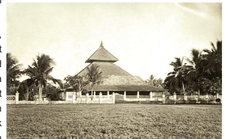
Masjid Agung Demak sebelum dibangun Menara.

Pada saat islam berkembang, seni bangunan berupa tempat pemujaan berupa masjid. Masjid didirikan dengan menganut gaya arsitektur khas Nusantara. Terdapat beberapa masjid yang dibangun dengan gaya punden berundak atau menyamai tumpeng, semakin ke atas semakin kecil. Lokasi