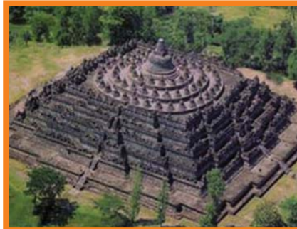
Gambar candi Borobudur