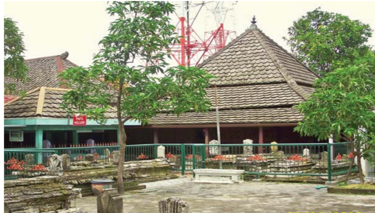
Makam Sunan Giri

Pada masa kerajaan Hindu-Budha, makam raja-raja (abu-jenazah) diletakkan didasar candi atau di atas bukit, begitu juga dengan keluarga kerajaan. Untuk menandai kematian seorang raja atau keluarga kerajaan dibuatlah prasasti yang menerangkan tentang masa hidup dan waktu kematian. Pada masa berkembangnya Islam, makam keluarga raja diletakkan dekat masjid (dibangun sebuah masjid dekat pemakaman) atau diatas bukit. Dibuatlah sebuah nisan dengan bertuliskan arab yang menerangkan waktu kematian. Dibuatkan bangunan cungkup untuk mengelompokkan makam keluarga. Contoh; Makam Sendang Dhuwur (Lamongan, Jawa Timur), Makam para wali, dll