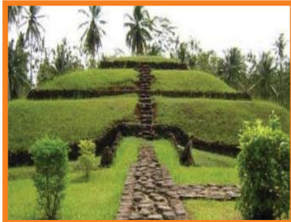
Gambar Punden berundak