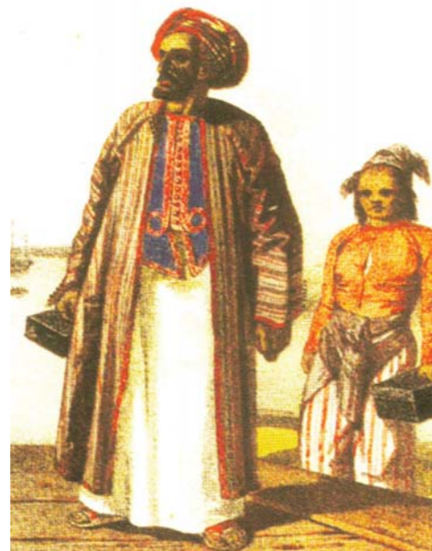
Ilustrasi pedagang Gujarat yang datang ke Nusantara, Sumber: Sejarah Kebudayaan Indonesia Masa Islam

Nusantara memiliki peranan penting dalam jalur pelayaran perdagangan, khususnya selat Malaka. Hal ini disebabkan karena posisi Nusantara yang