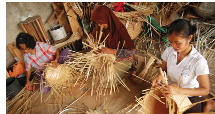
Gambar: membuat anyaman bambu