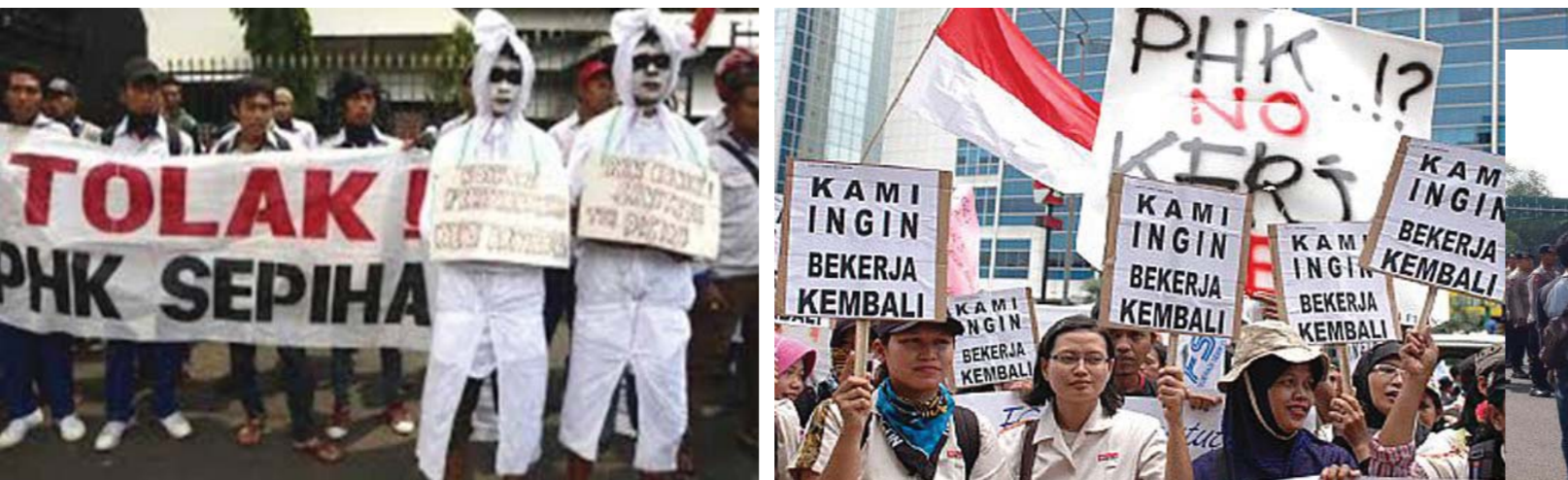
Gambar 3.3 Demonstrasi buruh yang menolak Pemutusan Hubungan Kerja (PHK) dan menolak pekerja asing

Salah satu contoh kelompok kepentingan adalah kelompok buruh. Mereka berkumpul dalam berbagai macam organisasi perburuhan di Indonesia. Salah satu kepentingannya adalah menolak pemutusan hubungan kerja melalui demonstrasi dalam gambar di bawah ini.