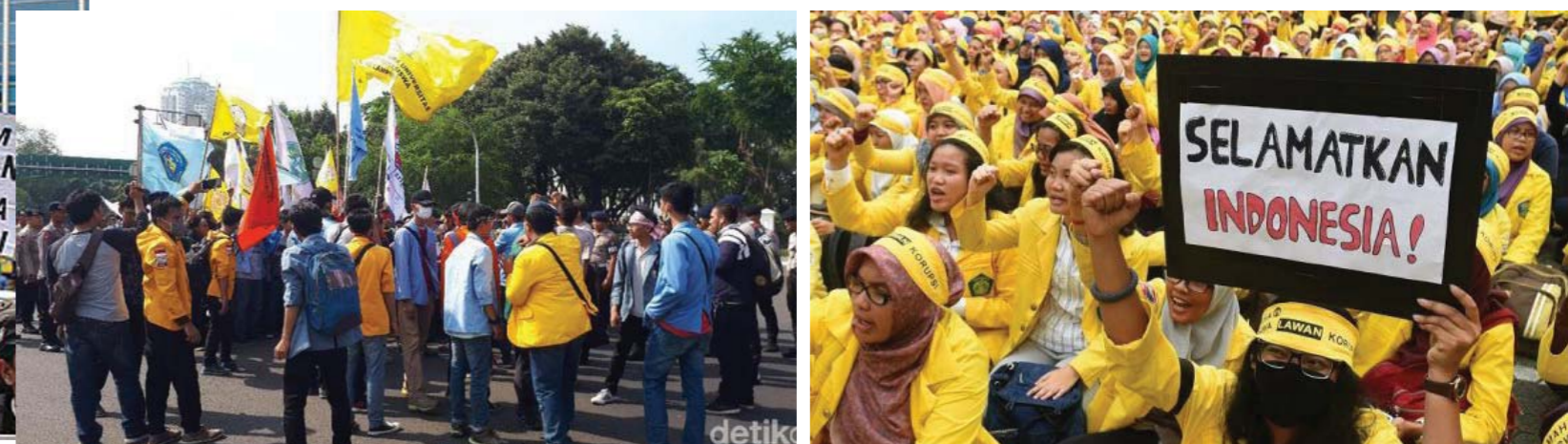
Gambar 3.4 Mahasiswa berdemo di depan Istana Merdeka

Salah satu contoh kelompok penekan adalah kekuatan mahasiswa. Mahasiswa dapat memberikan tuntutan tertentu kepada pemerintah atau kelompok lain yang dianggap tidak sejalan dengan kepentingan rakyat. Tuntutan mahasiswa dapat digunakan oleh pemerintah sebagai sarana untuk merefleksikan program pembangunan yang dijalkannya. Dengan demikian, kelompok penekan yang berasal dari mahasiswa ini memiliki nilai positif agar pembangunan berada dalam jalur yang mensejahterakan rakyat. Namun demonstrasi mahasiswa juga dapat berpotensi negatif bila dilakukan secara anarkhis, merusak dan membuat kerusuhan. Oleh karena itu, tempat dan waktu demonstrasi oleh kelompok-kelompok masyarakat perlu memberitahukan kepada kepolisian negara agar demonstrasinya terarah dan terkendali. Bagi peserta demonstrasi sendiri mendapatkan jaminan keamanan dalam menyalurkan aspirasinya.