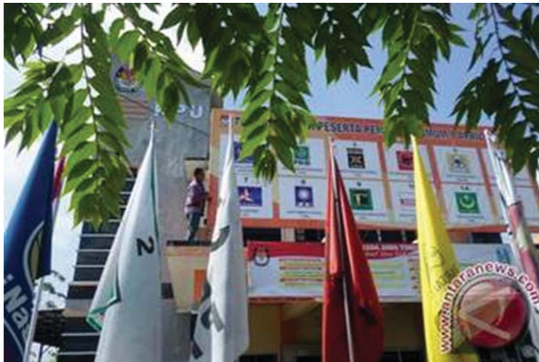
Gambar 3.1 Kantor Komisi Pemilihan Umum (KPU) dengan bendera partai-partai politik peserta pemilihan umum.

Coba kalian perhatikan Gambar 3.1 di atas! Apa yang dapat kalian jelaskan? Nah. Kantor Komisi Pemilihan Umum (KPU) memasang bendera-bendera partai-partai politik. Partai politik peserta pemilihan umum berbeda dalam setiap periodenya. Tunjukkan partai-partai politik yang kalian kenal!