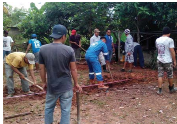
Gambar: Kewajiban Warga Masyarakat

Tuliskan hasil pengamatan Anda terhadap gambar di atas! Kegiatan-kegiatan apa yang sedang dilakukan?