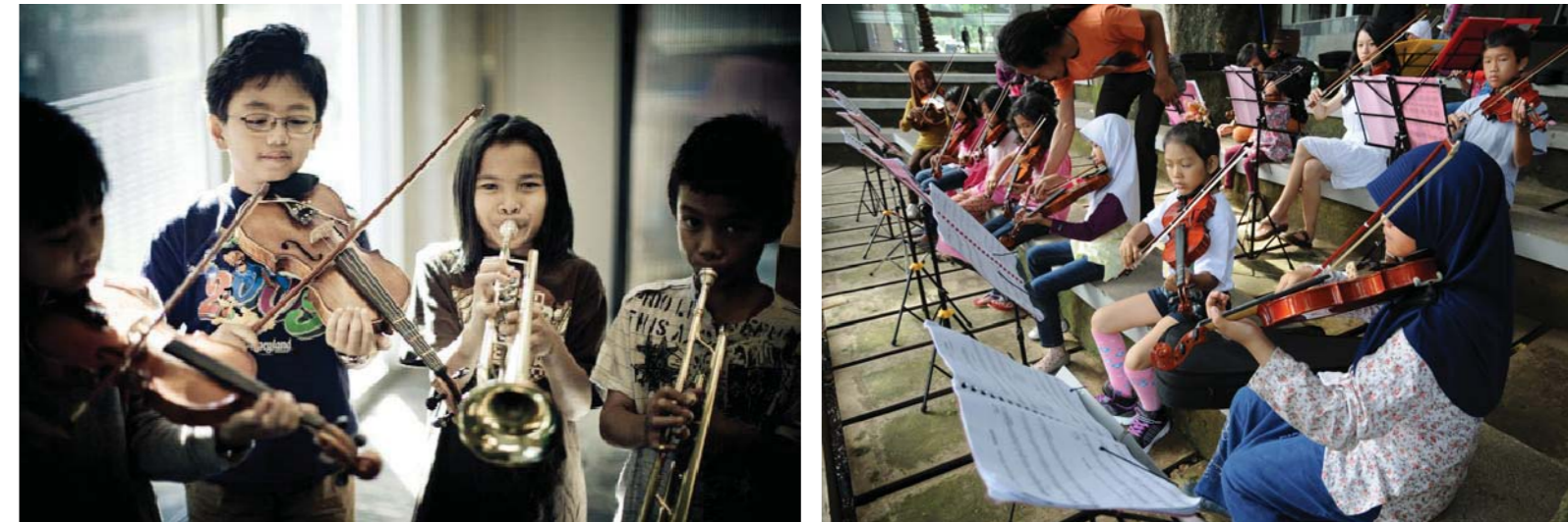
Gambar: Anak sedang memainkan alat musik

Gambar di atas menunjukkan bahwa sebagai warga masyarakat kita memiliki hak untuk mengembangkan bakat dan kemampuan di berbagai bidang, seperti: di bidang olah raga, music, atau bidang-bidang lainnya.