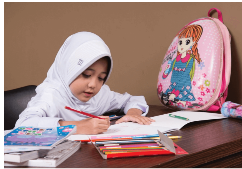
Gambar: Kewajiban anak di rumah

Gambar di atas merupakan contoh kewajiban yang dilakukan di rumah.