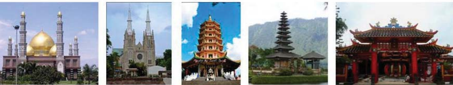
Gambar: Rumah-Rumah Ibadah di Indonesia

Apa yang tersaji dalam gambar di atas tentunya tidak asing lagi bagi kita. Tuliskanlah nama tempat ibadah dan untuk agama apa dalam kolom yang sudah disediakan.