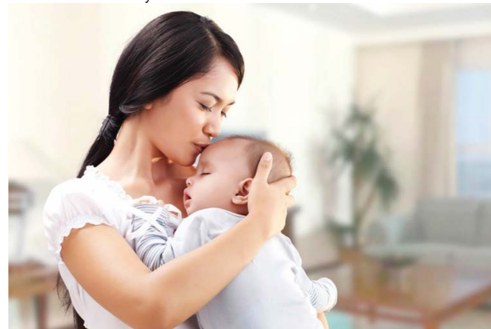
Gambar: Ibu sedang menggendong bayinya

Apa yang terpikirkan oleh Anda saat melihat gambar tersebut? Apa yang diperoleh bayi dari ibunya?