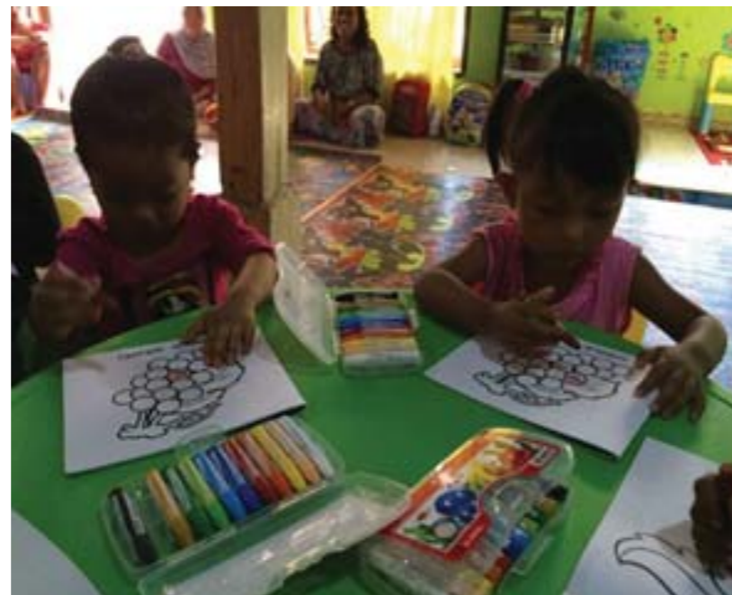
Gambar: Anak-anak sedang bermain dan belajar mewarnai gambar

Dari uraian di atas dapatkah Anda menyimpulkan pengertian dari hak? Coba diskusikan dengan teman Anda.